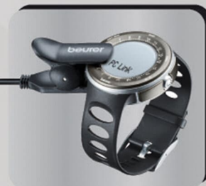
Software EASYFIT, compatible con Speedbox