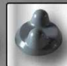
c) Botón 2