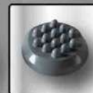
b) Botón 1